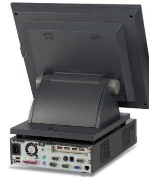
+POS Olivetti 15"